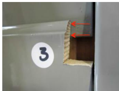
Abbildung 3: Musterstelle im Detail